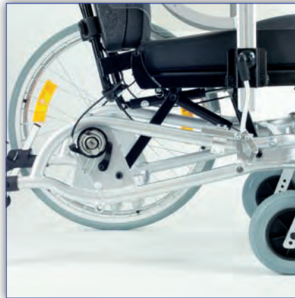
Aluminium-Rahmen aus Ovalrohr