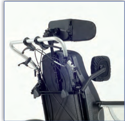
Kopfstütze und Pelotten optional